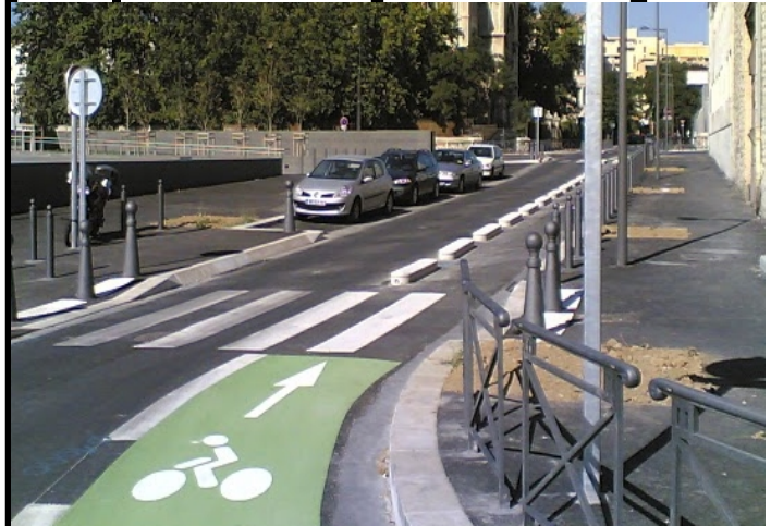
Rue Mirès Marseille